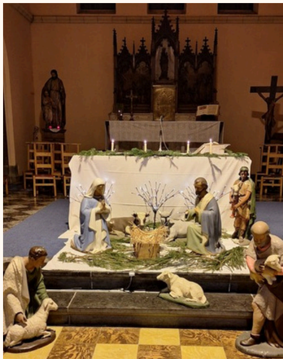
Noël : messe de Minuit à l'église de Lanaye