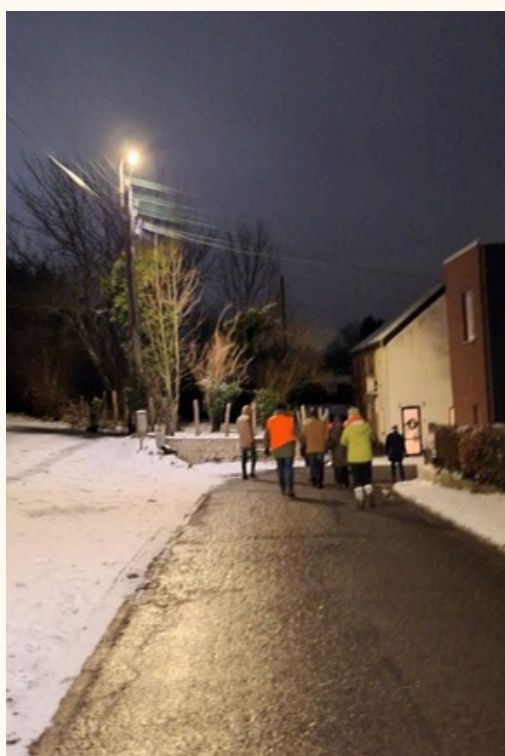
Le samedi 3 janvier dans la joie de la célébration de l'Epiphanie: manifestation de Jésus Dieu au monde, les Equipes de Fraternité de Route ont suivi l'étoile à travers la marche à l'étoile à Housse.